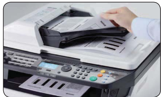
Hohe Produktivität durch Duplex-Einzug

Ein zentrales System wird oft von vielen benutzt. Daher ist es wichtig, dass vertrauliche Daten vertraulich bleiben. Die Funktion „Vertraulicher Druck“ stellt sicher, dass Ihr Druckauftrag erst nach Eingabe Ihrer persönlichen PIN am System gestartet wird. Die optionalen USB-Kartenleser von KYOCERA unterstützen alle gängigen Authentifizierungssysteme und Transpondertechnologien. Damit erreicht der Druckjob nur definierte und autorisierte Personen. Die Übertragung sämtlicher Druckdaten erfolgt sicher durch SSL-Verschlüsselung, IPsec und IPv6.