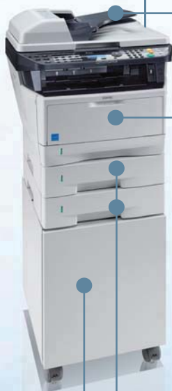
Automatischer Originaleinzug mit Wendung