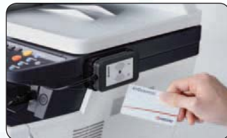
USB-Kartenleser für die sichere Authentifizierung