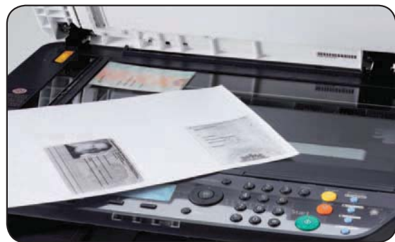
Einfache Ausweiskopie auf eine Seite per Knopfdruck