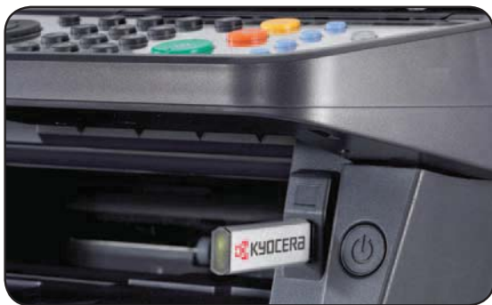
Drucken vom und Scannen auf den USB-Stick ohne PC